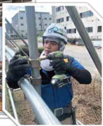
◆ 在建筑工地工作的越南人技能实习生 ◆

需要做出修改及调整。另外,对于在日本出生成长的青少年们,是不是也必须提出全面对应的方针政策呢,包括充实对家庭在内的收容体制,对外国人来说是在日本生活的安心感,是成为“被选中为接纳引进外国人的国家”的重要条件。