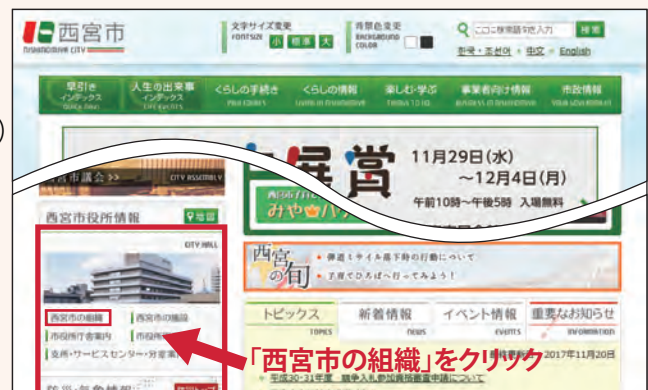
【西宮市ホームページ】