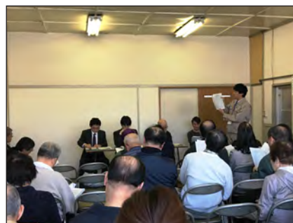
【準備組合設立総会の様子】