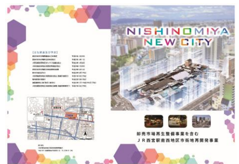
【事業リーフレット】

このたび当準備組合では、当地区周辺の関係者の方々や市民の皆様にご紹介するため、事業リーフレットを作成しました。事業リーフレットは、 JR西宮駅南西地区市街地再開発準備組合事務局事務所 または JR西宮駅南西地区まちづくり担当課(0798-35-3612) で配布しております。