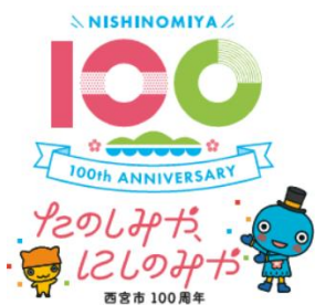
みやたん組み合わせ （タテ）