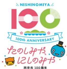
みやたん組み合わせ （タテ 顔のみ）