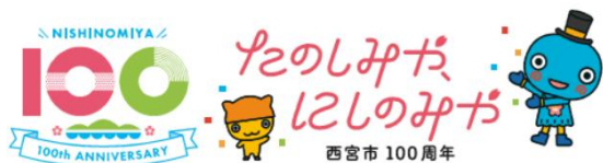
みやたん組み合わせ（ヨコ）