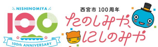
みやたん組み合わせ（ヨコ 顔のみ）